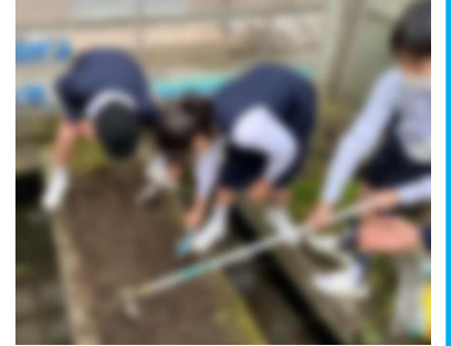
【生長に適しているかを種まきをして調べようとする様子】

この取組から、探究課題を解決するために、自分なりに試行錯誤しながら挑戦し続けようとする思いや自分自身の楽しみだけではなく、周りの人を笑顔にしたいという思いが伝わります。また、目標に向かって粘り強く取り組もうとする思いや気持ち、楽しみながら問題解決に取り組もうとする姿に「美しさ」が溢れていると考えます。このような「美しさ」のある姿は、学校生活の中だけではなく、地域や家庭の中においても見られるのではないのでしょうか。今後も学校や家庭が一体となり、子どもたちの「美しさ」のある言動を価値付け、子ども一人一人の自己有用感を高めていきましょう。